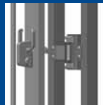
zamek na słupku czołowym