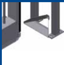
belka dolna płyta najazdowa